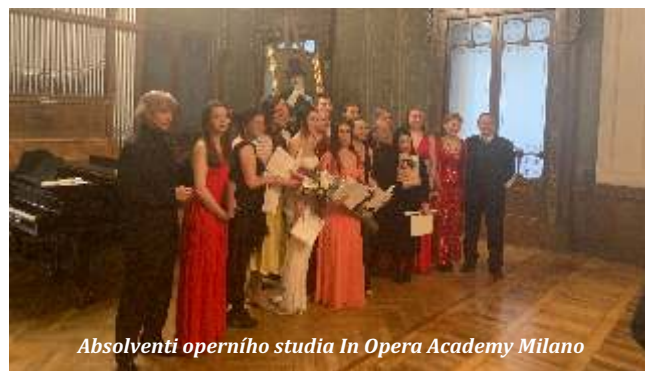
Absolventi operního studia In Opera Academy Milano