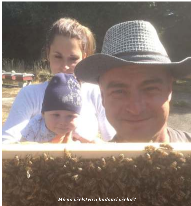
Mírná včelstva a budoucí včelař?

Samotná práce ve včelstvech. Od dubna do konce srpna je práce víc než 12 hod. denně, 7 dnů v týdnu. Když si naplánujete práci, musíte ji udělat v určitý den, určitou hodinu, nehladě na počasí. Večer padáte únavou z fyzického vyčerpání, ale psychicky jste na