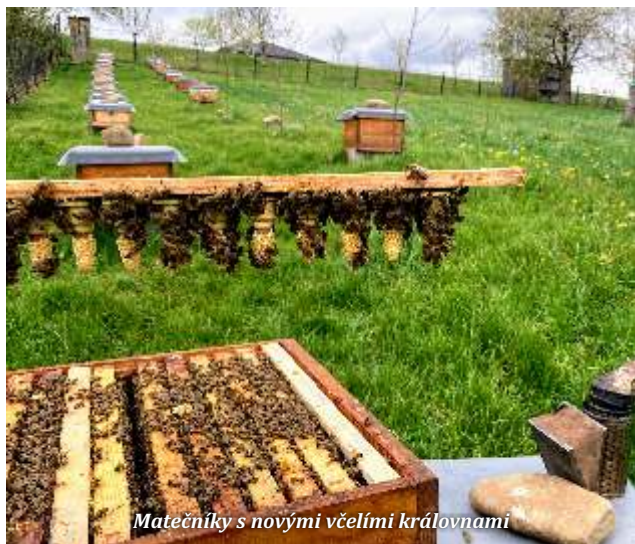
Matečníky s novými včelími královnami

Včely mají dva zásadní roční ukazatele, jimiž se řídí. Je to letní a zimní slunovrat. Roční období se u včel trochu liší. Je to předjaří, jaro, časné léto, plné léto, podletí, podzim a zima. Pro každé toto