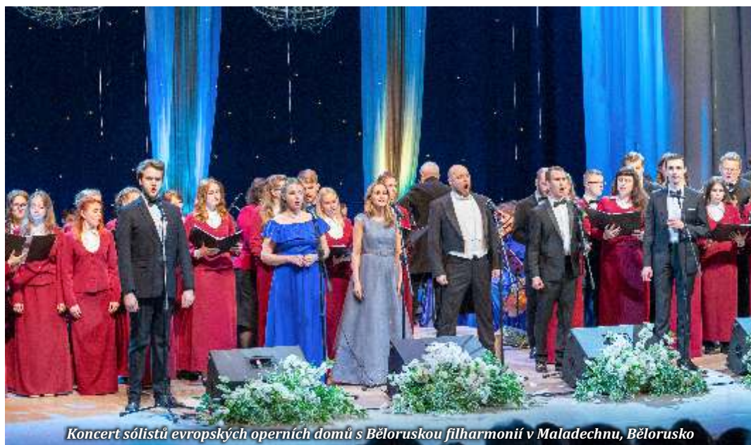
Koncert sólistů evropských operních domů s Běloruskou filharmonií v Maladechnu, Bělorusko

pokud máme správnou motivaci pro cokoliv, dokážeme si za tím jít. Já jsem se rozhodla vzít zodpovědně do svých rukou dar od Boha, který nechci nechat ladem a chci jím obšťastňovat srdce posluchačů, kteří mě chtějí slyšet. To rozhodnutí dělat umění by mělo pramenit z touhy vyjádřit sebe sama a promlouvat tak k ostatním. Důležité je si uvědomit, že ta cesta vás bude něco stát. A nemám na mysli vyloženě finance. Budete muset možná opustit své hnízdo, vydat se za příležitostmi, třeba i do zahraničí. Každý den na sobě