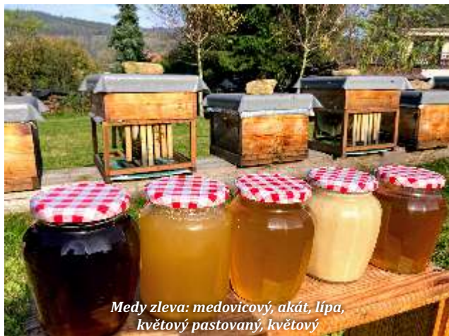
Medy zleva: medovicový, akát, lípa, květový pastovaný, květový

období je charakteristický rozkvět určitého druhu stromu a práce se včelami se tomu většinou přizpůsobují. Každý včelař by měl znát vývoj populace ve včelstvu a provádět ve zmíněném období určité zásahy u včel. Rozlišujeme období růstu včelstva, rozmnožování, regenerace a příprava na zimu odchováním dlouhověkých včel. V období růstu se včely rozšiřují, aby měli prostor pro další stavbu, možnost kam ukládat čerstvý nektar. Pokud to včelař nestihne, včelám se zdá jejich obydlí malé. Vezmou si sebou 3-4kg medu a zrojí se. Pokud uvidíte někde v květnu nebo červnu velký roj, není se ho třeba bát. Včely se většinou jen na čas někde usadí do doby, než si pátračky najdou nové obydlí, pak to místo opustí. Pokud budete vědět o nějakém včelaři v okolí, je na místě mu o tom říct. On si už potom poradí.