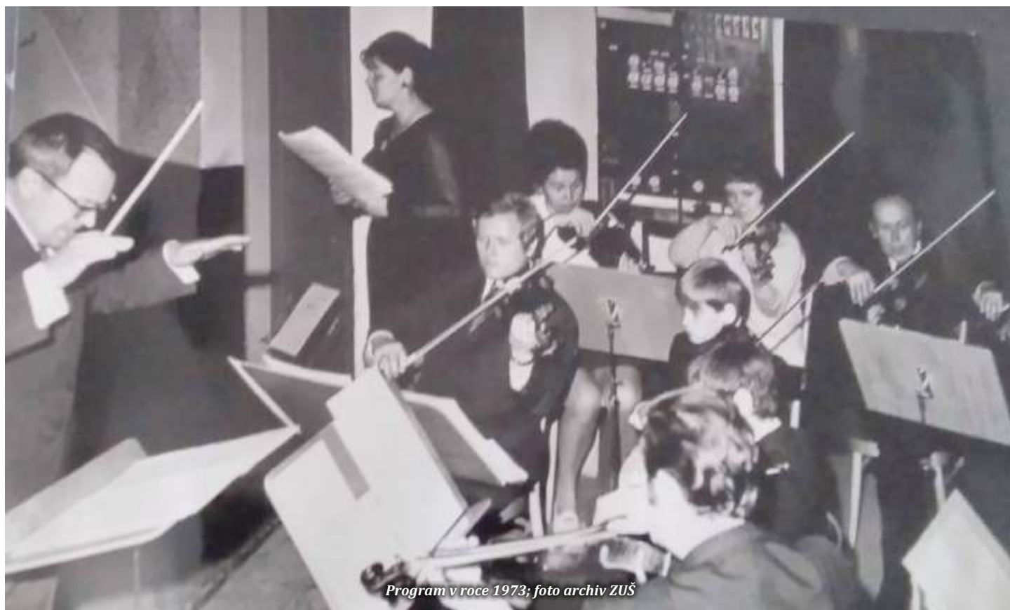
Program v roce 1973

„Proč se o tom sále tak rozepisují? Co na něm bylo tak zvláštního”? Hudebníci, kteří měli příležitost v něm vystoupit si určitě vzpomenou, že to byl sál s nejlepší akustikou široko daleko. Hrát v něm bylo pro účinkující požitek a pro posluchače nezapomenutelný zážitek.