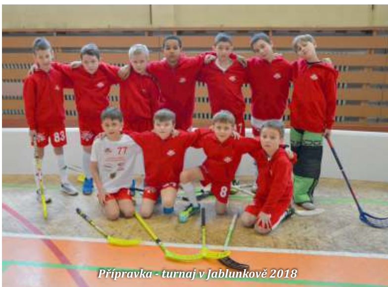
Přípravka - turnaj v Jablunkově 2018

Tehdy se starší žáci a muži přihlásili do České florbalové unie. Poprvé nastoupili do zápasu pod hlavičkou České florbalové unie, což jim umožňovalo účast na soutěžích v Moravskoslezském kraji.