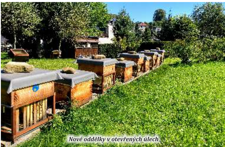
Nové oddělky v otevřených úlech