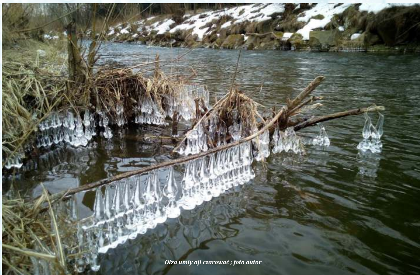
Olza umiy aji czarować

Bez wody nima pogody ani urody. Łónski rok był na wodę bogaty. W Goraliji spadło przez 1200 litrów na m 2 . Aktualnie je wody dość, bo przyroda a źródła sóm nabrane. Starczyło by se jynym o wodym dobrze starać, bo kiel