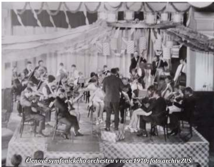
Členové symfonického orchestru v roce 1970