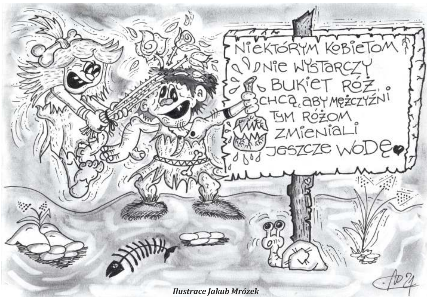
Ilustrace Jakub Mrózek

Ženy v březnu jsou roztomilé, ale také roztržité. Typické je pro ně silné osobní kouzlo a charisma. Potřebují, aby je ostatní vnímali a poslouchali je. Nedostatek pozornosti je rozčiluje a jsou z něj trochu nepřívětivé.